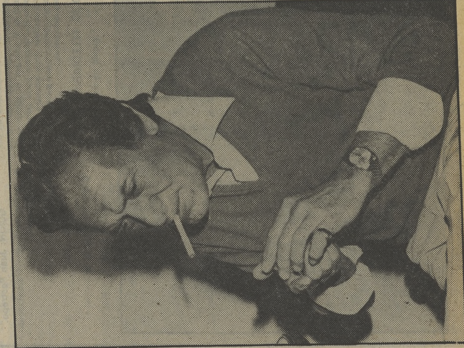
Alberto Closas es el actor invitado en «Anillos de oro»