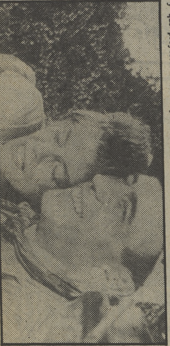
Boggy y Kathie se quieren intensamente en «La reina de África»

● Presentación y actuación de Gun Club y SPK.