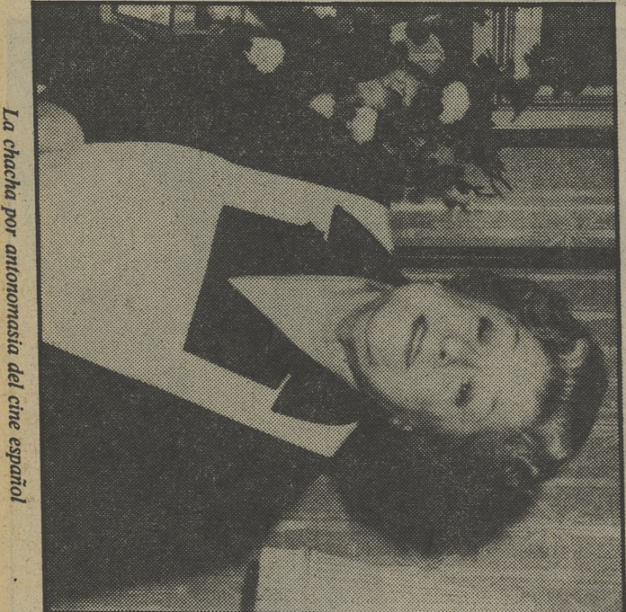
La chacha por antonomasia del cine español