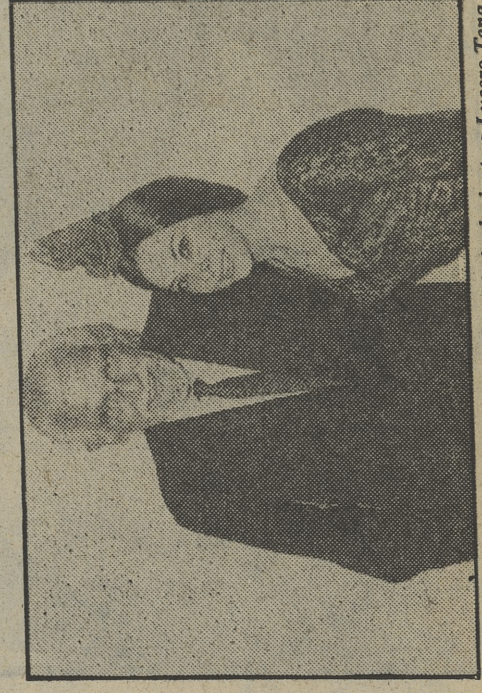
Boris Karloff, protagonista de «Código criminal», junto a Lucero Tena, en su última visita a España