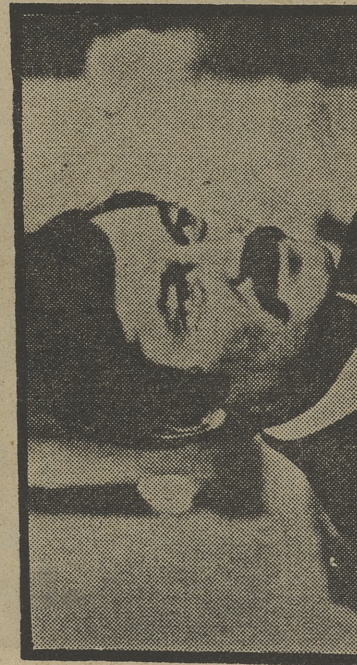
Roger Corman, un gran actor y director, en «De película»