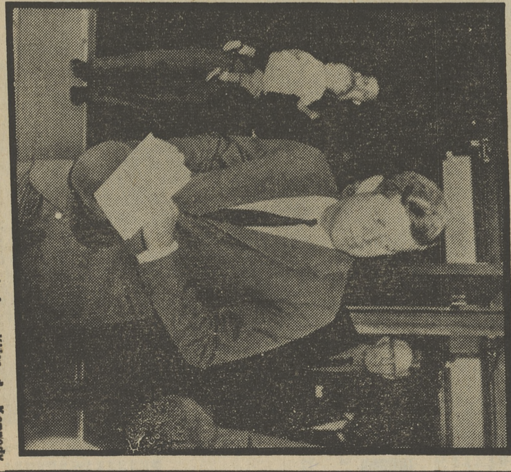
En Dallas terminó la fulgurante trayectoria política de Kennedy