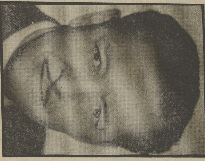
Ronald Colman, un hombre que las volvíis locas