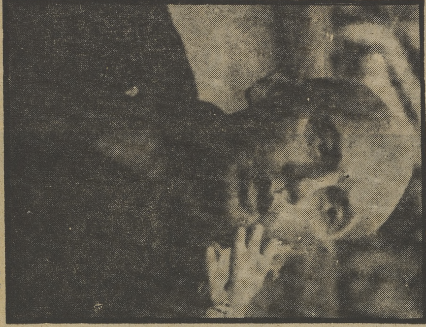
Yul Brynner, tan calvo como siempre, en «Terra Bulha»

20,00 NUESTRO AMIGO EL ESPANTAPAJAROS «EL CREA DOR DE WORZEL».