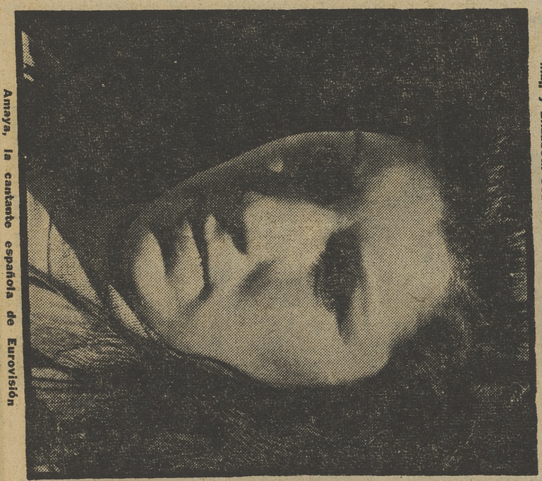
Amaya, la cantante española de Eurovisión