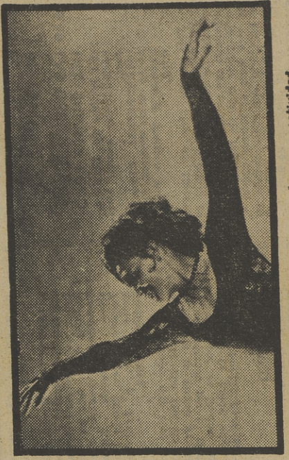
El patinaje sobre hielo, una hermosa actividad