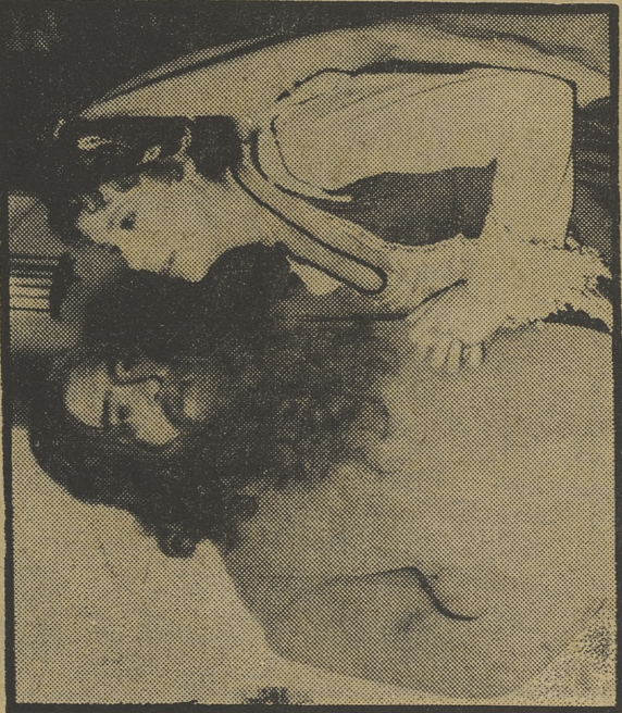
Una imagen de la nueva serie «Las picaras»