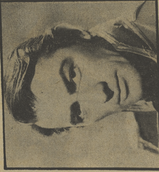
Gregory Peck hizo un inmejorable papel en «Matar a un ruiseñor»