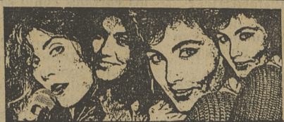
«Gloria», LAURA BRANIGAN