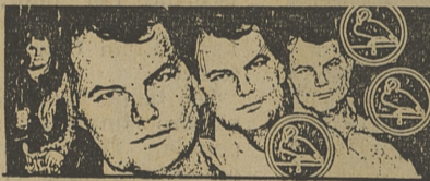
«Another page», CRISTOPHER CROSS