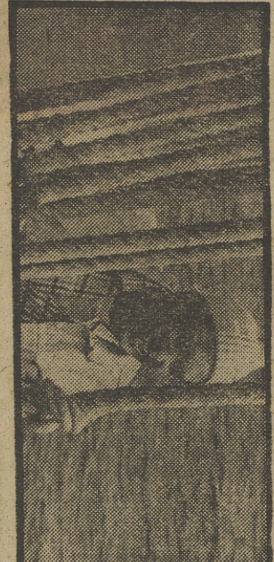
ALBERT FINNEY ES UN IMPICCABLE «TOM JONES», EN «SABADO CINE».