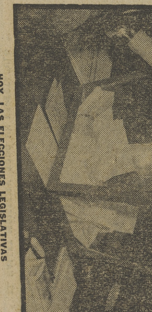
HOY, LAS ELECCIONES LEGISLATIVAS