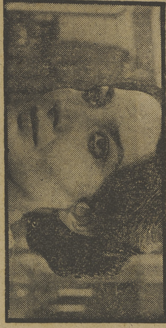
MARISA PAREDES, EN «TEATRO»