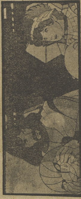
«ULISES 31», HOY, BUSCA UN SARCOFAGO

23,30 DE HOY A MAÑANA 0,15 DESPEDIDA Y CIERRE