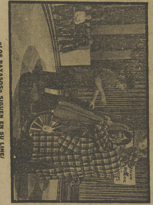
«LOS PAYASOS» SIGUEN EN SU LINEA!