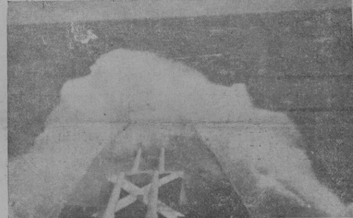
Un día de esta semana pasada, Franco, el Capitán de España, ha concedido la Medalla Militar a los héroes del «BALEARES».

La fija de la tragedia y el heroísmo en pie.