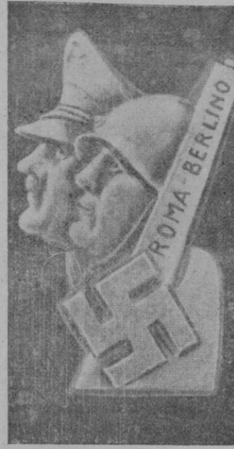
EL EMBLEMA DE LA VISITA

Se supone que este anfibio procede de grandes profundidades pues le rodeaban peces que no aparecen—según expertos—por nuestras aguas hasta a los meses de septiembre u octubre.