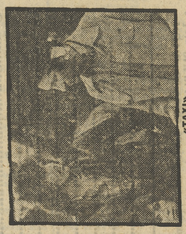
«TAXI» Dirección: James Burrows. Intérpretes: Juad Hirsch, Jeff Conaway, Danay de Vito y Joanna Cassidy.

Louis confía a sus amigos que tiene que asistir a una reunión de antiguos alumnos de su colegio. No obstante, recordando las malas pasadas que le hicieron sus compañeros y deseando vengarse, acuerda con Bobby que éste se haga pasar por él y que en la fiesta recuerde dos nombres: Sheila, que siempre le despreció, y Stanley Tarses, su enemigo personal.