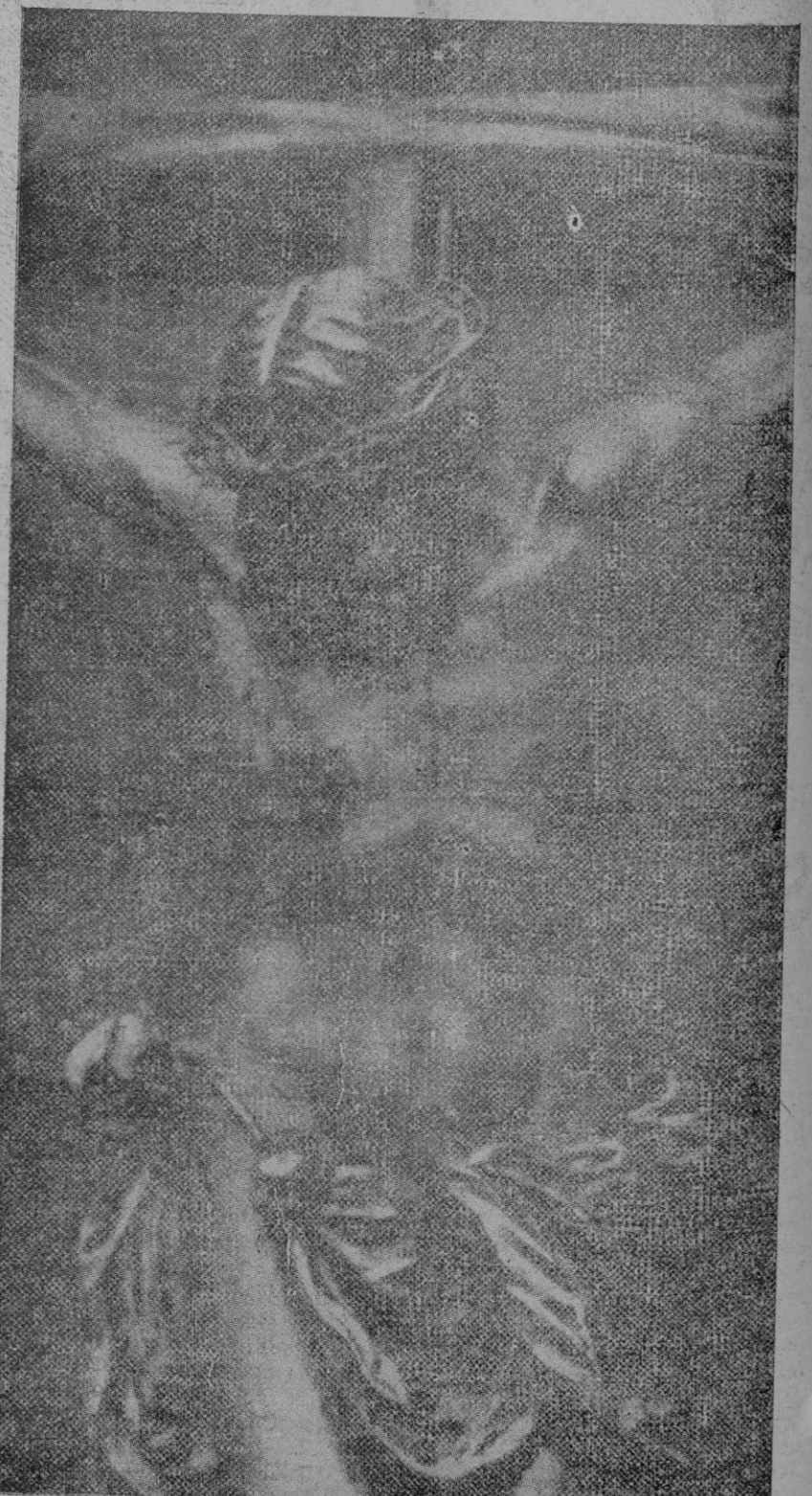
El Cristo de la Misericordia, escultura admirable de Juan de Mesa, que fué en un tiempo atribuida a Montañés.

Pero María y el grupo de las santas mujeres no habían podido resistir a la necesidad de ir al Calvario. Según una tradición que no aparece con signada en el Evangelio, María no es, pero siquiera a ese momento. Fué valerosamente antes que Jesús en tanto que subía El, pálido y ensangrentado, el camino del Gólgota, y los verdugos debieron verse obligados, respetuosos y casi conmovidos, ante los abrazos de la Madre y del Hijo. En la elevación (PASA A LA PAGINA 5)