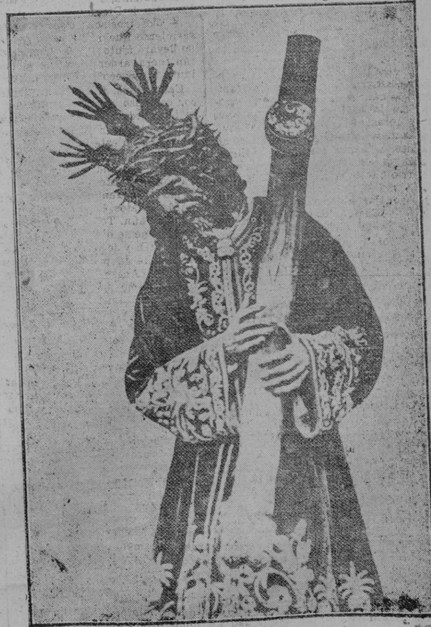
NUESTRO PADRE JESUS DEL GRAN PODER

Vigésimo quinto de nuestros puntos iniciales.