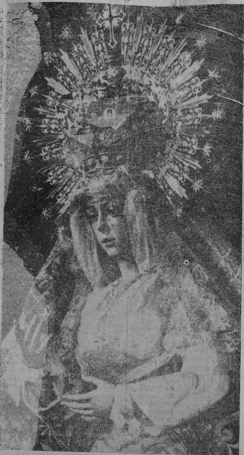
Maravillosa «Macarena» madre y orgullo de los sevillanos, la que ha visto a su pie la amenaza brutal del comunismo; la que vio florecer con el triunfo nacional la fe Española