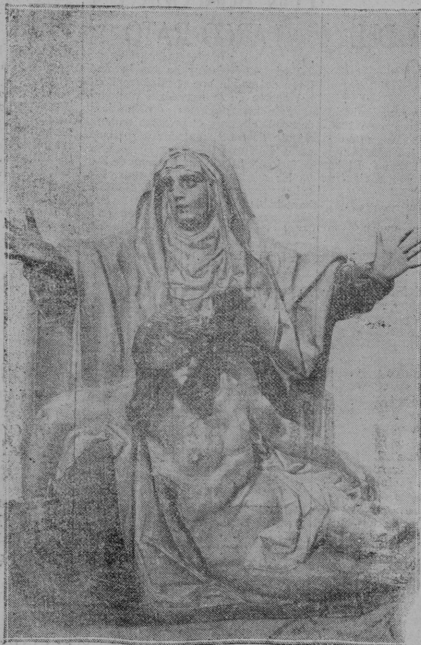
De la cruz desprendido, muerto le ves en tus amantes brazos, de sangriento sudario revestido....