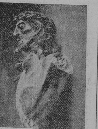
“Señor; perdónalos porque no saben lo que hacen.”