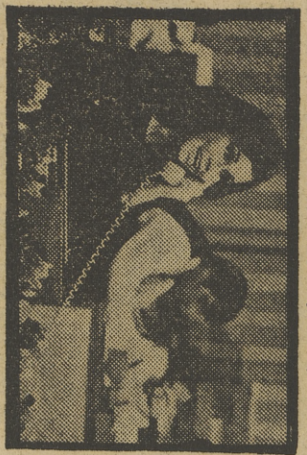
«LA CHICA DE LA TELE»

● Lou Grant, que ha decidido a Washington acompañado de Mary para participar en un seminario, se niega a admitir que ha perdido los excelentes contactos personales que un día tuvo en la capital.