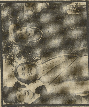
«EL GRAN CIRCO DE TVE»

Autores e intérpretes: Gaby, Miliki, Fofito y Milikito. Realización: Juan Villacueva. Gaby, Miliki, Fofito y Milikito presentan el gran circo de TVE, con las habituales atracciones circenses y el que patido concurso, en el que parejas de niños compiten en distintos juegos. Gaby, Miliki, Fofito y Milikito presentan además una aventura cómica y sus alegres canciones.