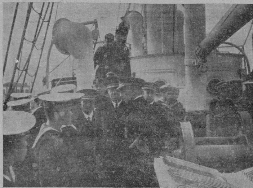
EN ESTA OTRA LO VEMOS PASANDO REVISTA A LOS MARINERITOS QUE FORMAN SOBRE CUBIERTA FENDIENDOLE HONORES

Después se resolvió que la moción aprobada por los otros estados presentes en la conferencia no será comunicada al Japón, sino que se hará conocer a los países participantes en la Conferencia como prueba de su actitud razonada.