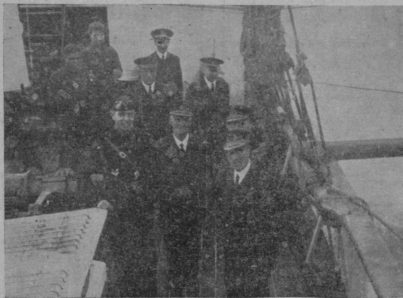
EL VICE-ALMIRANTE MORENO, JEFE DE LAS FUERZAS NAVALES, AEREAS Y TERRESTRES DEL BLOQUEO, VISITO EN LA MAÑANA DE AYER EL BUQUE-ESCUELA DE LOS FLECHAS NAVALES Y APARECE AQUI CON EL DELEGADO PROVINCIAL DE LAS O. J. Y EL PROFESORADO DE LA ACADEMIA

Praga.—Al abrirse la sesión de la Cámara, el presidente, aludiendo a las manifestaciones antifascistas hechas por los diputados comunistas y que provocaron una reclamación italiana, declaró su pesar por lo acaecido y llamó a los diputados la atención para que se atengan estrictamente al cumplimiento de sus deberes.