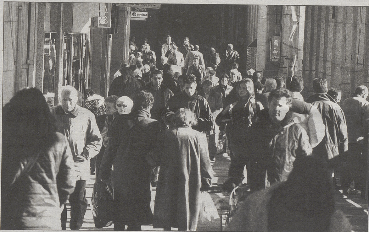
Una parte de los desempleados podrá incorporarse al mundo laboral a través de los cursos

A lo largo de los últimos años la partida destinada para los planes FIP ha visto incrementado su presupuesto pasando de los 22.237.447 euros (3.700 millones de pesetas) destinados en 1999 a los 34.858.702 euros (5.800 millones de pesetas) del pasado ejercicio. Se espera que en años posteriores la cantidad de dinero invertido siga aumentando.