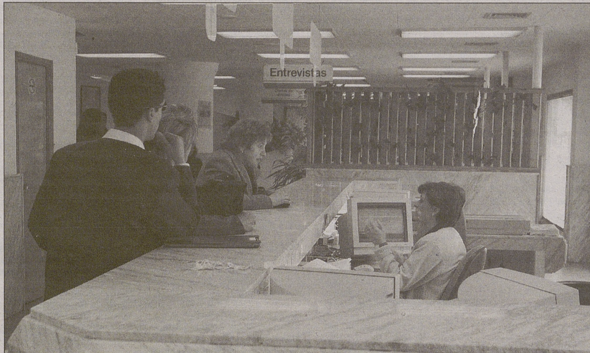
Solicitantes de empleo en la oficina del INEM de Ávila

Para el titular de Trabajo español, los objetivos marcados en Lisboa —pleno empleo para una década, lucha contra la pobreza, sostenibilidad de los sistemas de protección social, entre otros— tienen plena validez. En cualquier caso, el Departamento que dirige Aparicio ha dejado claro que el horizonte del pleno empleo para 2010 es un objeti-