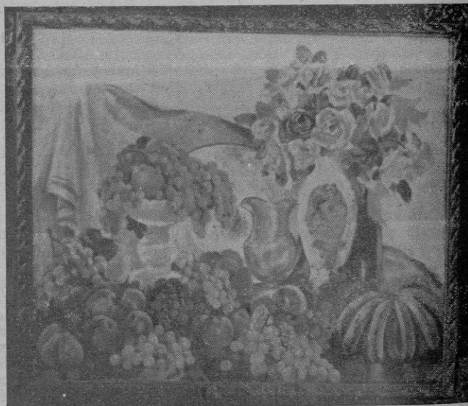
Bodegón. - Un bello estudio de color del Sr. Alejandro.

La exposición tiene el atractivo de agrupar a los pintores consagrados que en hermandad con los noveles nos mostrarán sus avances y superaciones.