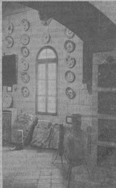
Un aspecto del Museo, en el que se guardan interesantes objetos que pertenecen a la historia de nuestra ciudad.

«—Presente de un Hábito de nuestro P. Custodio Fr. Antonio