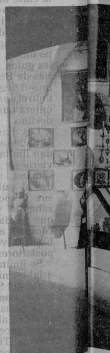
Otro aspecto parte de la túnica, del Archivo

predicador apostólico, hombre tanta santidad como hemos visto en diferentes ocasiones en sus sermones y predicaciones hechas en las iglesias como en las plazas y calles, habiéndole visto en varias ocasiones en éxtasis, es público y notorio; y por parte la oferta que ha hecho My. Rdo. Pe. Guardian del Hábito que ha presentado a los magistrados para que guarden memoria de su santidad y para devoción de todos, que dicho Sto. P. llevaría que partió, el cual por estar cortado en algunas partes, por algunas personas, que movidas de devoción le iban cortando, y tuvo que cambiar el día de su tida de esta isla para Mallorca que por eso se den, 25 libras vez tantum, para reparo y necesidad del convento, de la Ciudadela confiando en Dios n. s. esta limosna nos la resarcirá otros caminos, encargando Ms. se sirvan tener el citado Hábito en toda custodia en el cajón las 4 llaves, colocando dicho Hábito