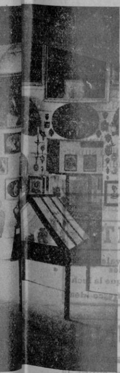
Museo, donde se guarda presente reportaje.