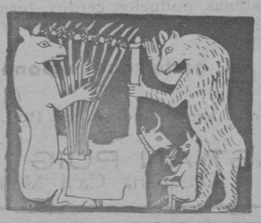
Aruto mitológico de Sumeria. La musica

dera con embutidos ornamentales y aplicaciones de oro y plata, ha podido ser reproducido mediante el trazado que las maderas al corromperse proyectaron sobre el suelo de la tumba.