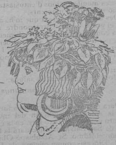
Tocado de Subad