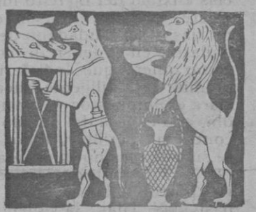
Aruto mitológico de Sumeria. Un sacrificio

estaban disfrazados de león y lobo y representaban actitudes de misterios, actuando como semidioses. Se ha llegado «al borde de la religión y del arte, a la frontera de la magia y el culto.»