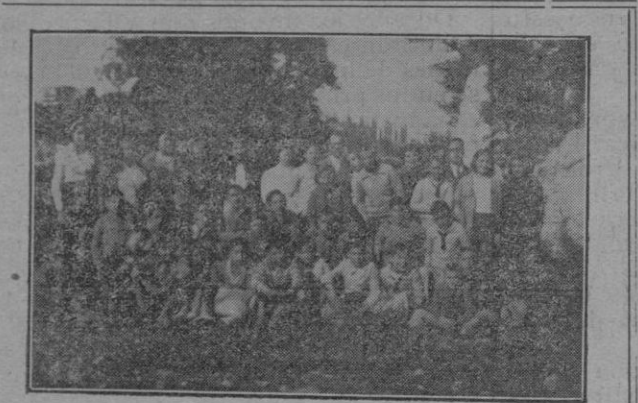
Los alumnos del Colegio Subvencionado en su visita al Castillo de Santueri

mentos en que los intereses cardinales de la patria exigen fusión de energías y, por tanto, la deposición de actitudes e incluso el sacrificio de compromisos sinceramente contraídos, puesto que los países que no saben fundirse sino para la guerra, los ciudadanos que no se conjugan y se aprietan para sostener un derrotero medular, de positivos y eficaces resultados, servirán para emplearse en bélicas contiendas que hoy nada producen ni nada hacen prosperar. Tales pueblos viven hacia atrás, de espaldas al futuro. El patriotismo es una serena y profunda batalla diaria para incorporar los timbres nuevos, los acentos depurados, las energías productivas de la existencia a la nacionalidad. Todo ello dentro de la razón y la justicia más extensa y estricta. Establecidas éstas como bases, lo demás sólo es trabajo, sin políticos matices, esfuerzo, sacrificio, allí donde sea menester el más constante y cerrado acuerdo, la más porfiada y tenaz acción para el desarrollo de una vida plena, suficiente para satisfacer las necesidades primordiales. Acción que