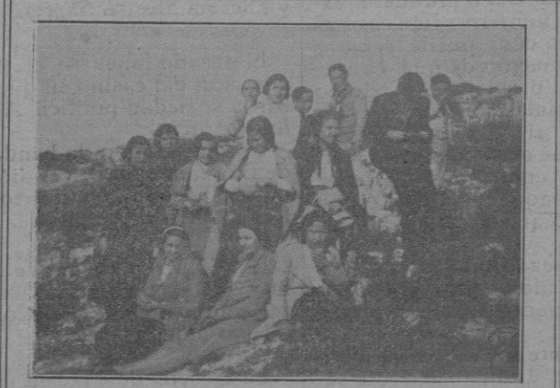
Alumnas del Colegio en un descanso en la visita a Santneri

tecer obras e iniciativas rigurosamente fértiles. Como ya todo el mundo investiga y aquilata la significación de términos con los que hemos fogueado el corazón, esas protestas sentimentales, excesivas, de patriotismo que tan a menudo llenan la boca de políticos espectaculares, hacen el mismo efecto que la voz del actor cuando desempeña un papel de contenido que demande la máxima potencia psicológica y lo fije todo a la resonancia verbal. El patriotismo, repito, no decae, como se asegura. Se deshace de ornamentaciones y hojarascas que tanto han contribuido a su falsificación, para convertirse en lo que de verdad es: una conciencia pura, un deber limpio, cumplir individual y colectivamente nuestra misión de hombres dentro del contorno geográfico en que nos ha tocado nacer. Pues el orgullo patriótico que se afina únicamente en el accidente del nacimiento o que se nutre de las gloriosas jornadas remotas, tiene mucho de habilidosa especulación. Porque en lugar de ser un estímulo, nos sirve para abstraernos a la responsabilidad que tales gravitaciones debieran ejercer sobre el ánimo para la continuación, dentro de los nuevos tiempos, de aquellas jornadas cumbres, de aquellos heroísmos contrastados que impregnaron de