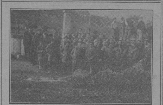
Los alumnos y profesores del C. S. en el Campo de Experimentación con el personal de la Estación Enológica

tecer obras e iniciativas rigurosamente fértiles. Como ya todo el mundo investiga y aquilata la significación de términos con los que hemos fogueado el corazón, esas protestas sentimentales, excesivas, de patriotismo que tan a menudo llenan la boca de políticos espectaculares, hacen el mismo efecto que la voz del actor cuando desempeña un papel de contenido que demande la máxima potencia psicológica y lo fije todo a la resonancia verbal. El patriotismo, repito, no decae, como se asegura. Se deshace de ornamentaciones y hojarascas que tanto han contribuido a su falsificación, para convertirse en lo que de verdad es: una conciencia pura, un deber limpio, cumplir individual y colectivamente nuestra misión de hombres dentro del contorno geográfico en que nos ha tocado nacer. Pues el orgullo patriótico que se afina únicamente en el accidente del nacimiento o que se nutre de las gloriosas jornadas remotas, tiene mucho de habilidosa especulación. Porque en lugar de ser un estímulo, nos sirve para abstraernos a la responsabilidad que tales gravitaciones debieran ejercer sobre el ánimo para la continuación, dentro de los nuevos tiempos, de aquellas jornadas cumbres, de aquellos heroísmos contrastados que impregnaron de