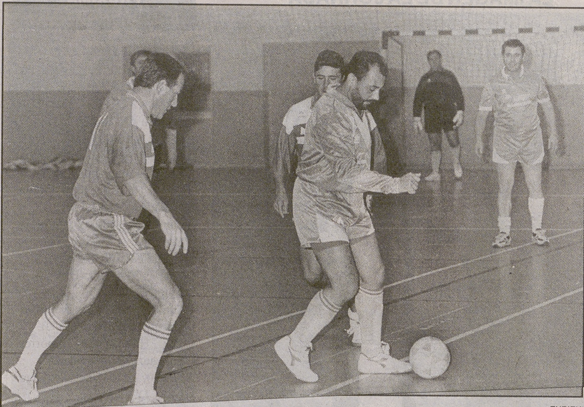
Un jugador del Cafetería RENFE protege el balón ante el acosos de dos jugadores del Mafecar