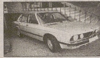
BMW 524. Turbo Diesel. Año 87. ABS. D.A. Pocos kilómetros.