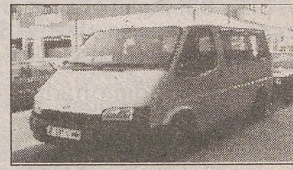
FORD TRANSIT Mixta. Año 92. Perfecto estado.