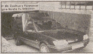
FORD COURIER 1.8 D. Año 94. 50.000 kmts.