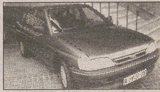
FORD ESCORT 1.8 CLX Diesel CC, RC, EE. Año 92