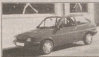
FORD FIESTA MOD. 88 ECONÓMICO