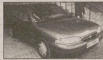
FORD MONDEO 1.8 CLX. Airbag. DA, CC, EE, AA. Año 93. 56.000 kmts.