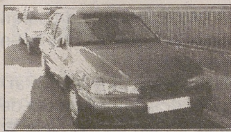
DAEVO NEXIA GL 5P Año 95. 13.000 km. Airbag D/A