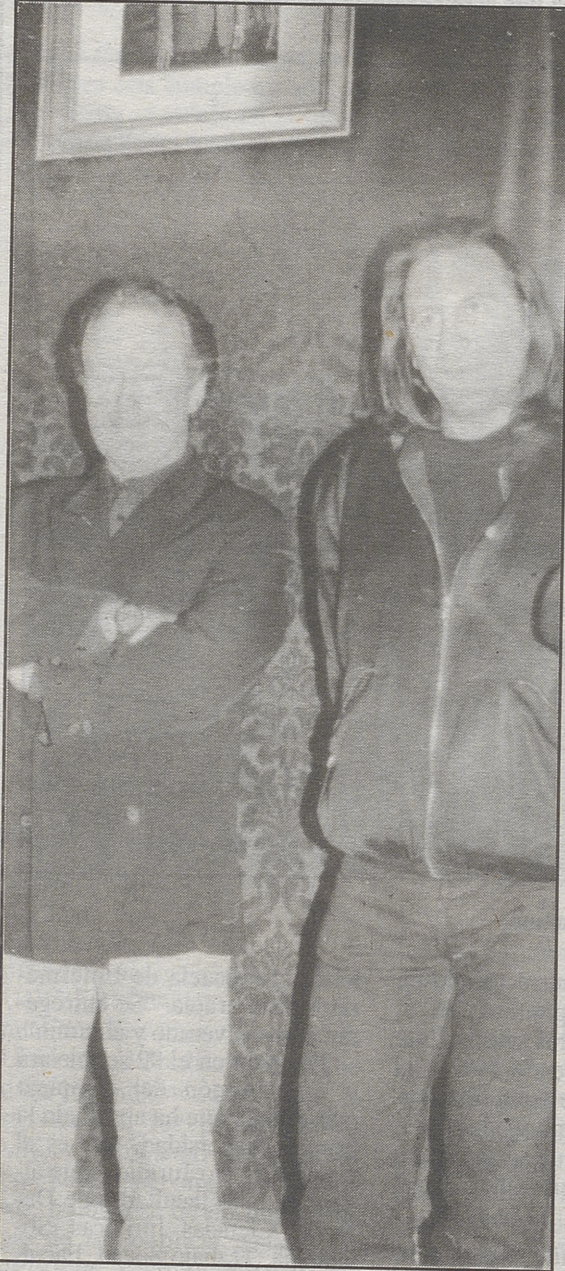
Scott y Depardieu, en la recepción ofrecida en Salamanca. En la fotografía de al lado, un momento del rodaje.

Ridley Scott, su director, declaró en Salamanca que "estamos ante una buena película gracias a Gérard Depardieu". Scott no ha-