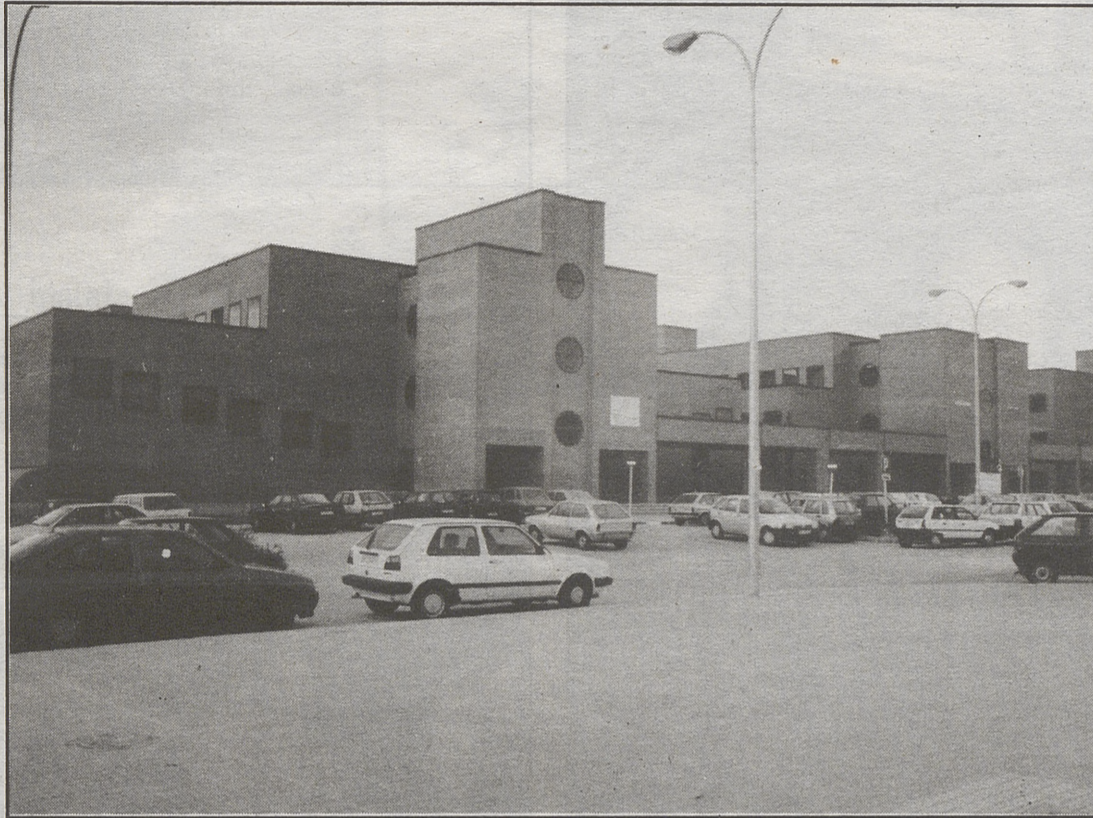
Facultad de Medicina, enclavada en el Campus Unamuno.

La otra Residencia, se financiará por diversas aportaciones, aún sin desglosar, aunque ya hay varias instituciones privadas que tienen intención de participar en la financiación.