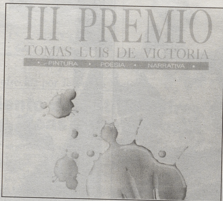
Cartel anunciador del Premio

Escuela de Restauración. Actualmente se está trabajando en la elaboración del Plan de estudios y profesorado y Plan de financiación para la nueva Escuela de Restauración que abrirá la Universidad Pontificia en Ávila,