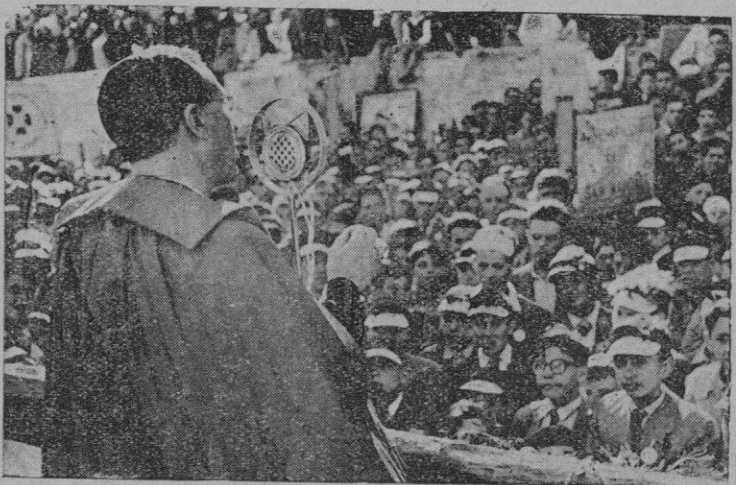
Con ocasión del XIV Día Diocesano del Aspirante de Acción Católica celebrado el jueves en Montuiri, se celebraron en dicha villa importantes actos que culminaron en la concentración en que el Excmo. Sr. Obispo dirigió la palabra a 1.500 muchachos (Véase información en página 6)

el séquito del Presidente portugués. El pueblo de Madrid ha tributado un calurosísimo recibimiento al ilustre Presidente del país hermano, extensivo al Caudillo de España, al paso de ambos Jefes de Estado por las calles madrileñas en esta espléndida mañana del mes de Mayo.