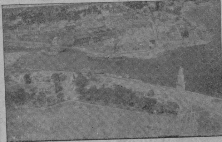
Nuestro fotógrafo Bernardo CAS TELL logró desde el avión esta bella panorámica de Porto-Pi

—Actualmente tenemos encargado un pedido de 100 aviones «Viscount - Discovery», de motor turbina, sin pistón, de gran ve-