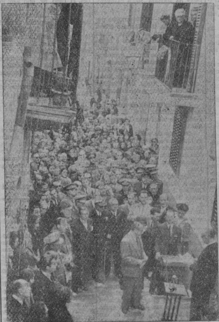
Un detalle del acto de descubrir la lápida colocada en la casa donde nació D. Antonio Maura Montaner.

Don Antonio Maura Montaner (Continúa en la pág. siguiente)