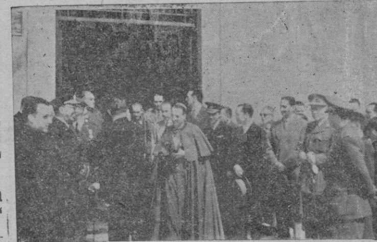
Nuestras primeras autoridades al salir del importante acto celebrado en la mañana de ayer.