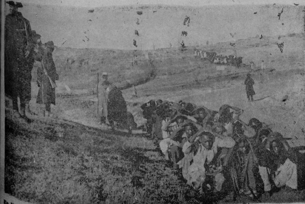
En Kenia sigue la rebeldia de la secta de los Mau Mau, ferozmente antiblanca y cuyos procedimientos terroristas han atemorizado a la colonia británica. — Un grupo de Mau Mau, apresado por la policía y fuerzas regulares, dispuestos para su traslado de arresto.