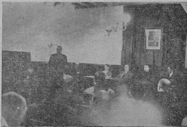
Presidencia del acto inaugural de la Semana celebrado anoche en la Casa de Cultura de la «Caja de Pensiones»