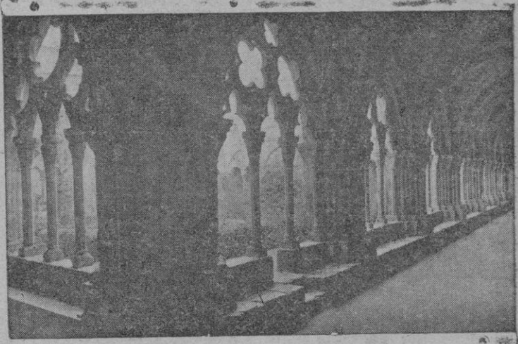
Claustro del Monasterio de Poblet

TARRAGONA, 3 (Cifra). — Al rededor de la una de la tarde, con una solemnidad impresionante, han salido de la puerta del templo catedralicio los féretros que contienen los restos de los Monarcas de la Corona de Aragón, interpretándose el himno nacional por la banda militar, repicando las campanas de todos los templos tarraconenses en señal de duelo, mientras los cañones de los buques de la escuadra española "Legazpi" y "Magallanes" artillados en el puerto disparaban las salvas de ordenanza, rindiendo a los Monarcas del antiguo reino de la Corona de Aragón honores correspondientes a Jefe de Estado.