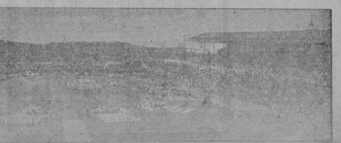
La multitud que se reunió en la explanada exterior del templo de San Esteban.