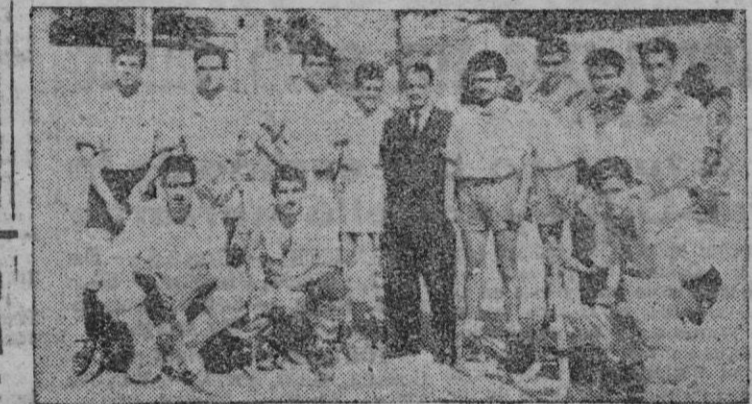
Los equipos, con el Tesorero de la facional de Hockey sobre patines.

Anteayer por la mañana en la pista del Hispania y con motivo de la estancia en Palma del señor Mingo, Tesorero de la Real Federación Española de Hockey y Patinaje, contendieron el equipo local y el La Salle, terminando el partido con la victoria de este último por la diferencia de 7-2.