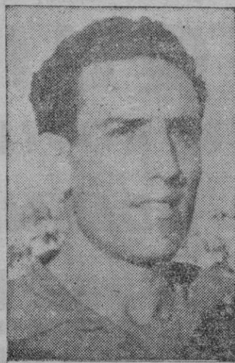
Prats, que jugó un gran partido

4-0 en el marcador, a fin de cuentas. La goleada pudo haber sido mayor. ¡Cuántas veces, con el marco abierto casi de par en par, el disparo salió desviado, fuera! En la fase final de la contienda, "entregado" ya el cuadro salmantino, fué esto —¡la línea de tiro!— lo que falló.