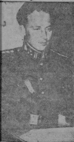
LEOPOLDO III DE BELGICA

Los jefes de los tres partidos políticos. Primeramente hablará el Rey Leopoldo en flamenco, y luego lo hará en francés, mientras que el