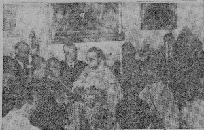
Bendición por el Prelado de la primera sala recién construida y habilitada con asistencia del Gobernador Civil, el Alcalde, el Presidente de la Audiencia Territorial y otras autoridades.