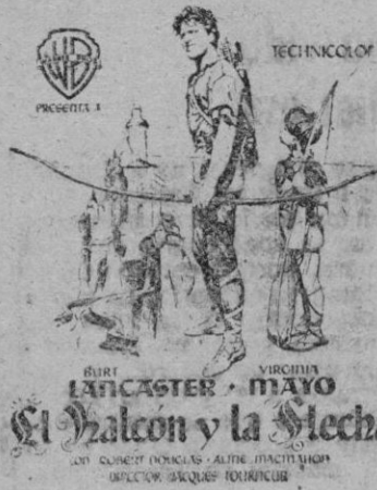
El Halcon y la Flecha BURT LANCASTER - VIRGINIA MAYO UN QUINCE DONALD - ALNE - MACTH - MICH DIRECTOR: JACQUES TOURNEUR

¡Deslumbrante! ¡Espectacular ¡¡Un programa!! a todo color!!