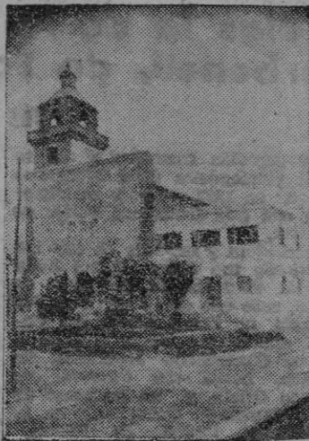
La nueva Vicaría de Capdepera adosada a la iglesia parroquial, y que fue recientemente bendecida