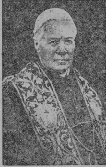
CIUDAD DEL VATICANO, 4 (Efe). — Su Santidad el Papa Pio X fallecido en 1914, será beatificado en una ceremonia que se

Será un gran acontecimiento eclesiástico