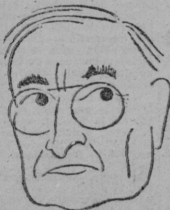
EL PRESIDENTE TRUMAN

También se entrevistaron Schuman y Acheson