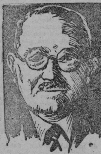
EL PRESIDENTE AURIOL

WASHINGTON, 29. (Efe). — El Presidente Auriol y su esposa han pasado la noche en “Blair House”, después del banquete oficial dado en su honor por los señores de Truman.