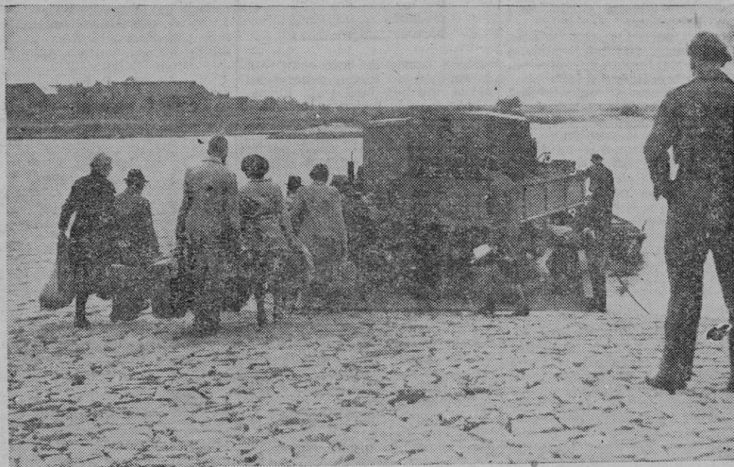
El bloqueo de Berlín. Los ciudadanos de los sectores occidentales deben efectuar su traslado al Oeste de Alemania de un modo u otro. Destruídos los puentes del Elba, han vuelto a aparecer las viejas gabarras como medio de transporte entre ambas orillas.

Prohibida la reproducción total o parcial en España, Marruecos y Colonias, sin previa autorización.