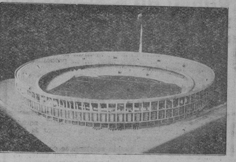
El magnifico estadio del Racing bonaerense

Con la conquista de un nuevo campeonato, el segundo de la era profesional al Racing ha brindado el deporte argentino su magnífico estadio, semejante al de Río de Janeiro, que bautizado con el nombre de "residente Pe-