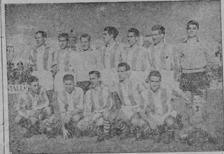
Este es el equipo del Atlético Baleares que venció al Eldense y que, imbatido, encabeza el quinto grupo de la Tercera División. ¡Que dure, amigos!