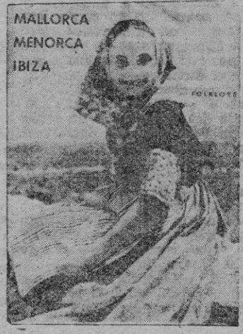
MALLORCA MENORCA IBIZA