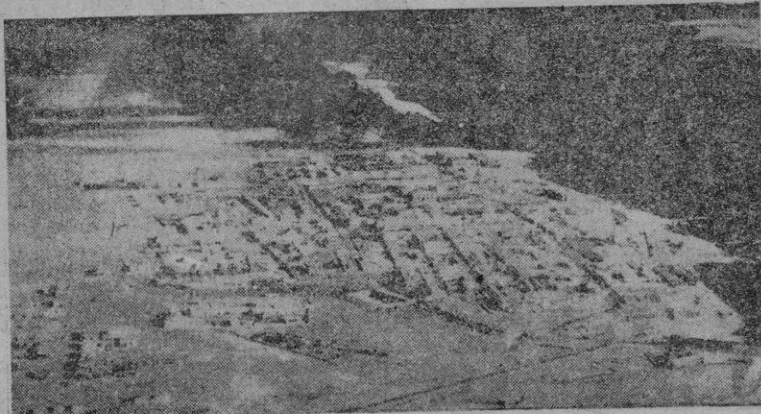
Vista de la plaza de Tobruk

Del "Diario" de Rommel se desprende que había sido utilizado anteriormente por la "División Fantasma" en Arras y contra los británicos. La información británica afirma, por su parte, que no es cierto y que nuestro primer encuentro con el referido cañón ocurrió el 16 de Julio de 1941, en el desierto occidental. Sea lo que fuere, se trataba de una