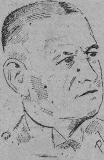
El almirante Raeder, jefe de la armada alemana

POSIBLEMENTE en el bando enemigo nadie presenció una actuación más activa y eficaz — con excepción de la del propio Rommel, se entiende — que la realizada por Fritz Bayerlein en el desierto occidental. Procedente del ejército de Guderian de Rusia, llegó a Africa en Octubre de 1941, abandonándola únicamente en Mayo de 1943, después de ser herido y rechazado, poco antes de la rendición.