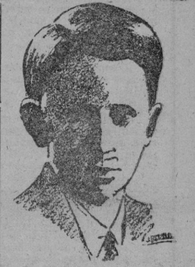
EL PRINCIPE BALDUINO

des de Flandes y de seis condes de Hainaut, y después de las Cruzadas, el de cinco reyes de Jerusalén descendientes de los condes de Flandes. El príncipe, según la tradición, lleva los títulos de duque de Brabante y príncipe de Bélgica.