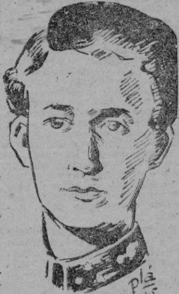
Leopoldo III de Bélgica

Mientras tanto, puntualicemos algunos detalles. Subrayemos en primer lugar que la base parlamentaria en que se apoya el nuevo Gobierno no es una mayoría aplastante, pero es una mayoría: 108 diputados socialcristianos, contra 104 de la oposición, o sea cuatro votos de más y no uno, como se creyó en un principio. La mayoría del Senado será de siete puestos próximamente. Sin embargo, el tanto por ciento de los votos obtenidos por el partido socialcristiano no es mayoritario, sino del 47'69 por 100 nada más. El Gobierno, como se sabe, está solamente formado por parlamentarios socialcristianos y presidido por M. Juan Duvieusar, senador por Charleroi y de gran prestigio no sólo en su distrito valón, sino en todo el conjunto del país. Los ministros salientes liberales han sido sustituidos por políticos jóvenes; de los nuevos ministros, señores Moreau de Melen, Van Houtte, Harmel, Dequae, Coppe, De Tacey; el más joven, señor Dequae, tiene 34 años, y el menos joven, señor Moreau de Melen, tiene 47 años. A la experiencia y el prestigio de un Eyskens, de un Van Zeeland, de un Carton de Wiart, se unen en el Gobierno la juventud y el entusiasmo de unos cuantos hombres surgidos a la política después de la guerra.