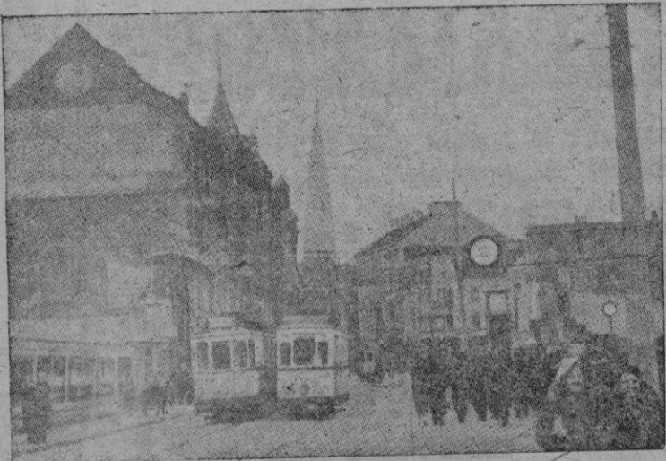
Una calle de Saarbrücken, la capital del Sarre