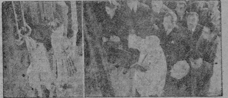
La ceremonia de la bendición, actuaron de padrinos