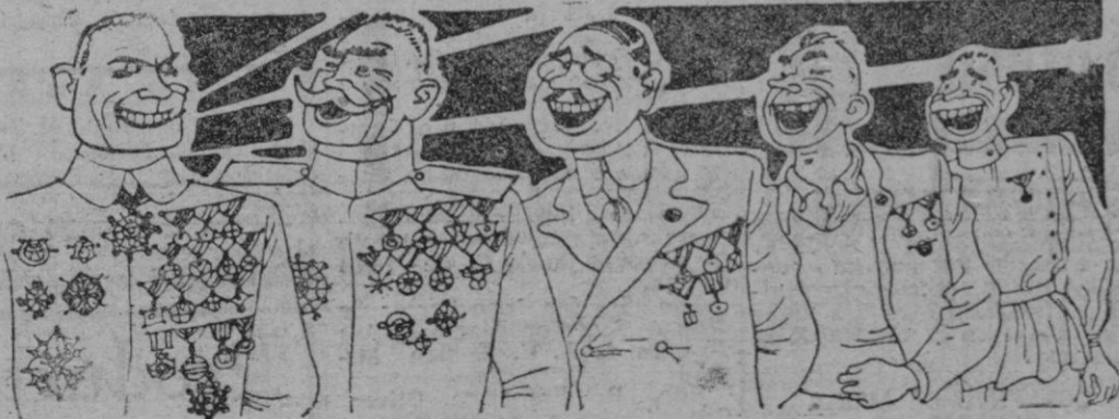
CUANDO EL COMISARIO SONRIE... (De "The Reporter". — Nueva York)