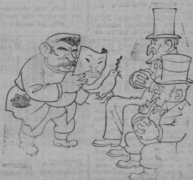
—Hagan la vista gorda una vez más y reconozcanme como el Gobierno legal de China.