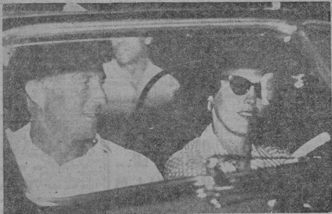
La foto nos presenta al rey Leopoldo de Bélgica conduciendo el coche de su propiedad, junto a su esposa, la princesa de Rethy, dirigiéndose a las pistas de golf de Kapallo.

Y M. Spaak, refiriéndose al príncipe heredero, añadió: "¿Cuál será, después, de esta consulta sobre el rey la posición de su hijo? ¿Se cree verdaderamente que el joven príncipe puede reinar al día siguiente de esta afrenta hecha a su padre? Si el resultado del referéndum da menos del 55 por 100 de votos al rey, será la monarquía la que estará en peligro. Cuando las clases dirigentes quieren perderse no hay nada que pueda detenerlas... Pero supongamos que el rey obtiene un poco más del 55 por 100 de los votos, entonces, hágase lo que se haga,