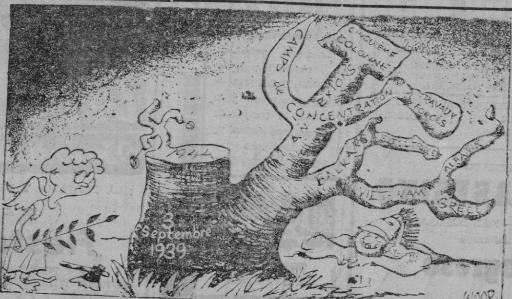
A LOS DIEZ AÑOS DE LA GUERRA — ¡Cómo retoña este árbol!

en opinión de los observadores, a la táctica británica de negar la desvalorización hasta el último momento.