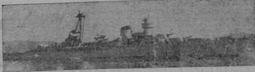
También es airosa la silueta de este buque de guerra, que fue botado en 1934 y desplaza 5.857 toneladas. Su andar es de 37 millas y va armado con 8 cañones de 152 mm.; 6 de 100 y 8 de 37, más cuatro tubos lanzatorpedos. Su potencia es de 96.000 caballos. Lleva además catapulta con un avión