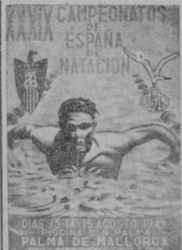
Cartel anunciador de los Campeonatos de España de Natación y Saltos que se han de disputar en la piscina del C. N. Palma los días 13, 14 y 15 de Agosto próximo.

Vista la posición del cuerpo veamos ahora la posición y movimiento de los brazos y piernas: la brazada del sprinter ha de ser rápida, procurando desde luego que los brazos no se crucen, estos "salen" a la altura de los hombros y se alargan lo más posible, sin efectuar lo que técnicamente se llama "retrapan" o sea la espera de un brazo al otro dentro del agua. El batido de pies es rápido y efectúan de seis a ocho batidos de pie, por brazada. En el de medio fondo, la posición americana es muy diferente, pues na lan mucho más planos. El cuerpo está estirado hasta casi su posición normal, el ataque de los brazos es a la vez más lento, más aprovechador de la brazada, o sea que ésta es mucho más profunda a la vez que más alargada que en el "sprinter" y efectúan el "retrapan". Al ser el batido más lento los brazos y las piernas dan la impresión de cruzarse y podemos darnos cuenta de que los talones ascan al exterior del agua, dando la impresión de cruzarse y podemos darnos cuenta de que los talones ascan al exterior del agua, dando la impresión de un motor de una lancha. Para terminar, tratemos de la respiración. Esta en el "sprinter" es igual a la "del medio fondista": unilateral y así no produce ningún desequilibrio del cuerpo.