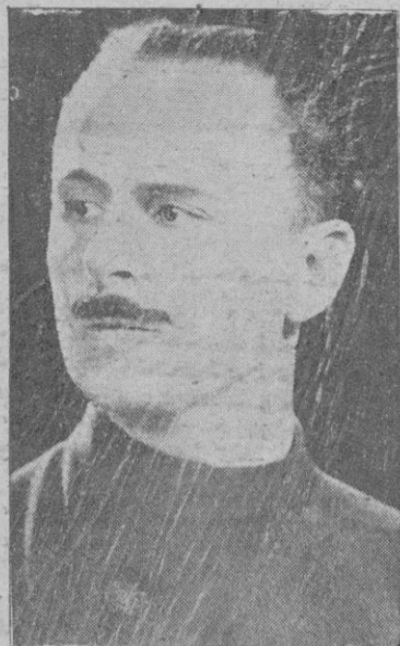
SIR OSWALD MOSLEY

bien formado, tipo de perfectos aristócratas ingleses, en su porte y en sus maneras de