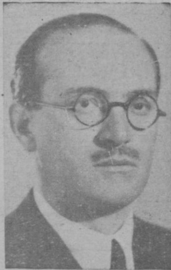
El Excmo. Sr. Ministro de Educación Nacional

Parlamento irlandés en la que se protesta contra las decisiones del inglés encaminadas a dividir aquel país. Nosotros dice, aprovechamos esta coyuntura para poner de relieve nuestra actitud frente a la desconsideración de que somos objeto en otros Parlamentos en donde se nos paga.