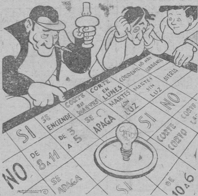
EL NUEVO JUEGO DE LA LUZ