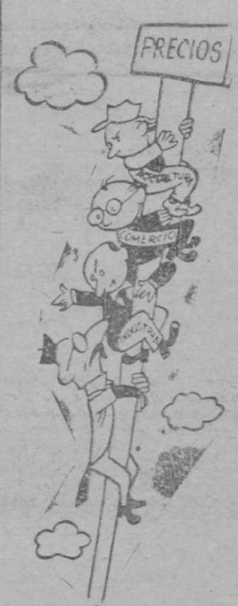
—Si usted no empieza a bajar, ¿cómo quieres que descendamos nosotros? (De "L'Aurore" - París)