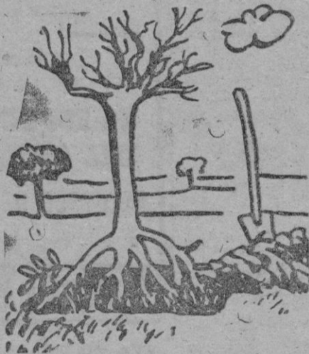
REFORMA AGRARIA