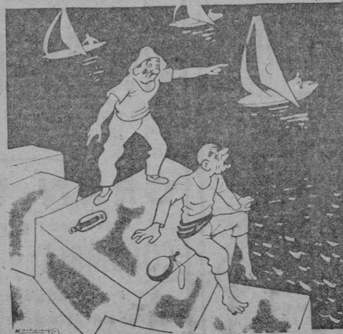
—Primero van a la vela y luego les dan la copa. —Ya. Igual, que nosotros, pero al revés.