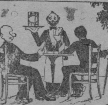
Los Barquillos Galindo son el complemento de un buen helado, se fabrican en todos los gustos. Calidades inmejorables. Calle Cordelería núm. 14.

La segunda parte es obvio hacer comentarios. Una empuñada competencia entre "Ora Ponciano" y el "Gran Sabino" que con los dos novillos que han de lidiar mantendrán en vilo a cada momento al público por su emocionante toreo.