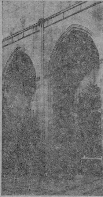
La basílica de San Francisco, segundo foco en Mallorca — el primero es Petra indiscutiblemente — de devoción juniperiana.

Angeles". En la Exposición Park de Los Angeles hay una Placa de bronce dedicada al P. Serra. Lleva una larga inscripción laudatoria y contiene una reproducción de la fachada de la antigua Misión de San Gabriel. Fue inaugurada en 1918.